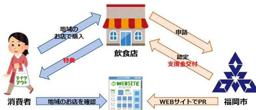
図1 事業イメージ図